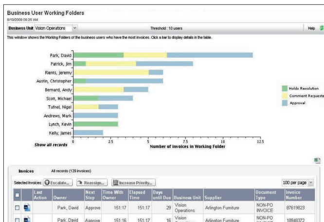
Trabajos en procesos externos a AP

Como Kofax MarkView AP Advisor está completamente integrado con los procesos que controla, permite a los gestores financieros anticipar situaciones futuras y resolverlas directamente desde dentro de la aplicación. Otras herramientas pueden proporcionar datos transaccionales, pero los gestores deben acudir a otros sistemas y medios (correo electrónico o teléfono) para actuar.